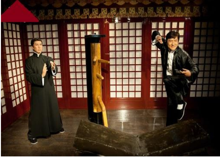
متحف الشمع الذي يُعرض فيه تماثيل شمعية لأشهر الشخصيات الآسيوية