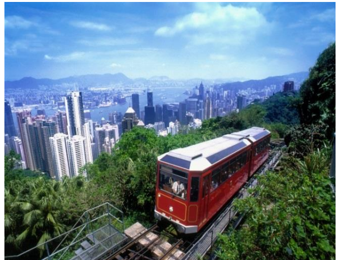
ترام البيك - The Peak Tram