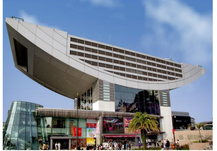
مركز التسوق (The Peak Galleria)